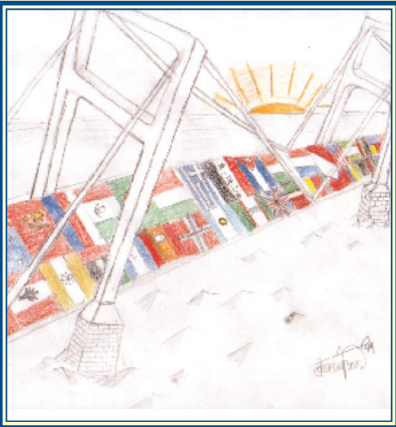
— рисунок учащегося шестого класса Джэрмена Карра (муниципальная школа PS 137, учебный округ 5), победителя конкурса 2004 г. на лучший логотип для программы ELL "Bridges to Excellence"